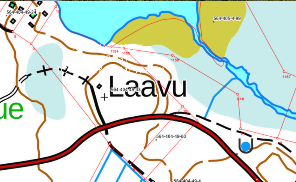
SANGINKONTU - TAIDERASTEJA JOKIVARREN METSISSÄ