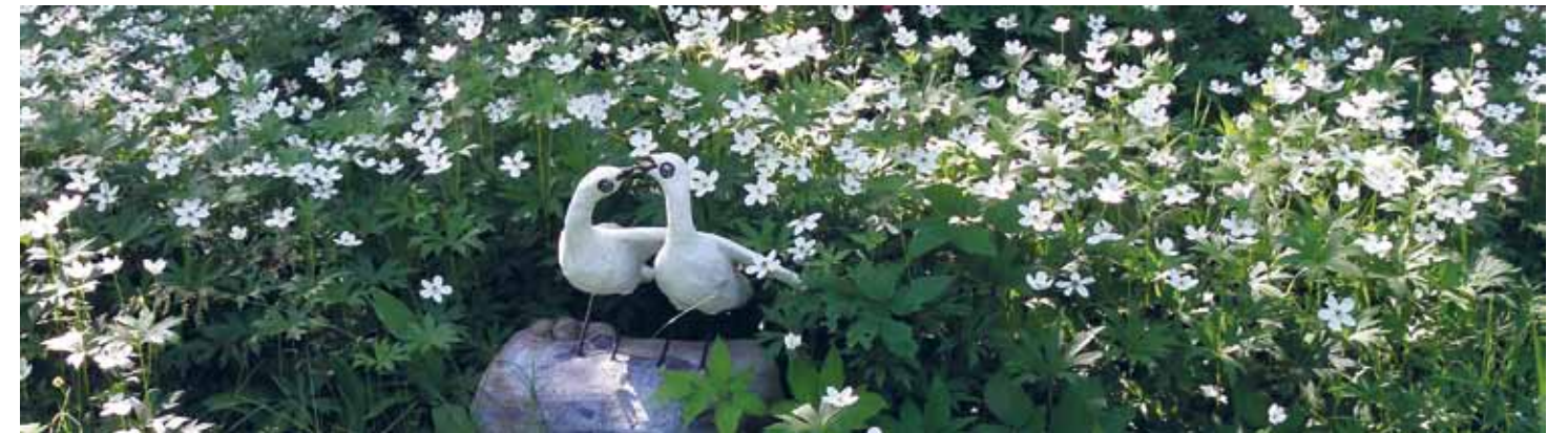
Kilpiangervo, ukonhattu, kanadanvuokko.

ra- ja virginiantuomi. Sieltä löytyy myös pieni allas, jossa viihtyy suomenlumme. Lapsipatsaat leikkivät sammalnurmella, luonto on auttanut puutarhuria, valinnut oikeat sammallajit ja kylvänyt ne.